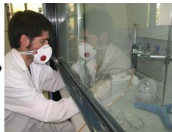
Campana de extracción